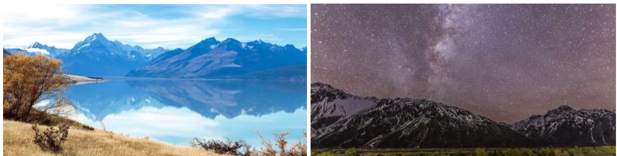
（左：普卡基湖畔远眺库克山；右：库克山国家公园的银河壮景）

如果你热爱徒步，胡克山谷（4小时往返）或Kea Point步道（2小时往返），是今天下午不能错过的体验！要是期盼以最近距离观赏新西兰第一高峰与最大的塔斯曼冰川，别忘了报名库克山冰雪着陆景观飞行。