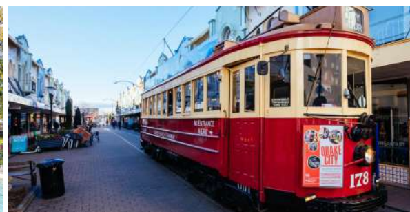
（左：基督城植物园；右：基督城观光有轨电车）

在奥克兰机场，你将搭乘下午的航班飞往南岛第一大城市——基督城，第二天你将从这里开始南岛 7 日 Stray 旅程。傍晚在市中心，你还有时间去基督城植物园或哈格雷公园、大教堂遗址、硬纸板过渡期大教堂和纪念地震遇难者的“185 张白椅子”等地点自由游览。