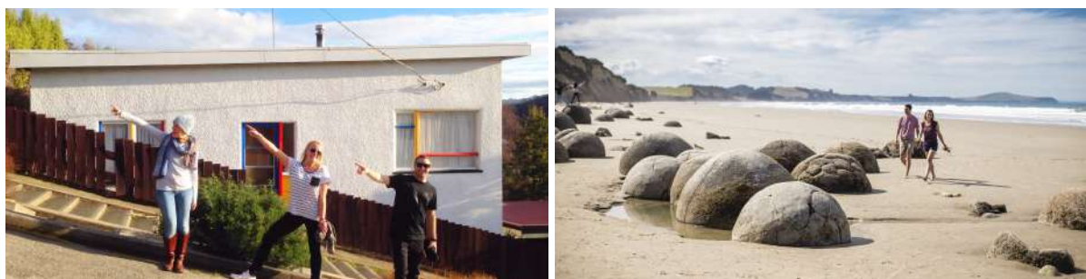
(左：但尼丁鲍德温斜街；右：摩拉基大圆石海滩)

旅行的最后一天，你将从“攀登”但尼丁北郊的鲍德温街开始。这里曾被吉尼斯世界纪录评为“世界上最陡”且仍在通行机动车的道路，现在仍是“南半球最陡街道”。所以“摸”、