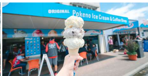
（左：汉密尔顿花园；右：普基诺小镇品尝冰淇淋）

回到奥克兰之前，你会在小镇普基诺品尝到份量十足、味道浓厚的新西兰冰淇淋。不妨试试 Hokey Pokey（香草冰淇淋配麦奴卡蜂蜜太妃糖）这个新西兰独有口味，让你沉浸在甜蜜里。