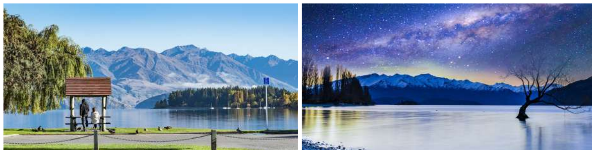
(左: 瓦纳卡湖畔景致; 右: 瓦纳卡湖的璀璨星空)