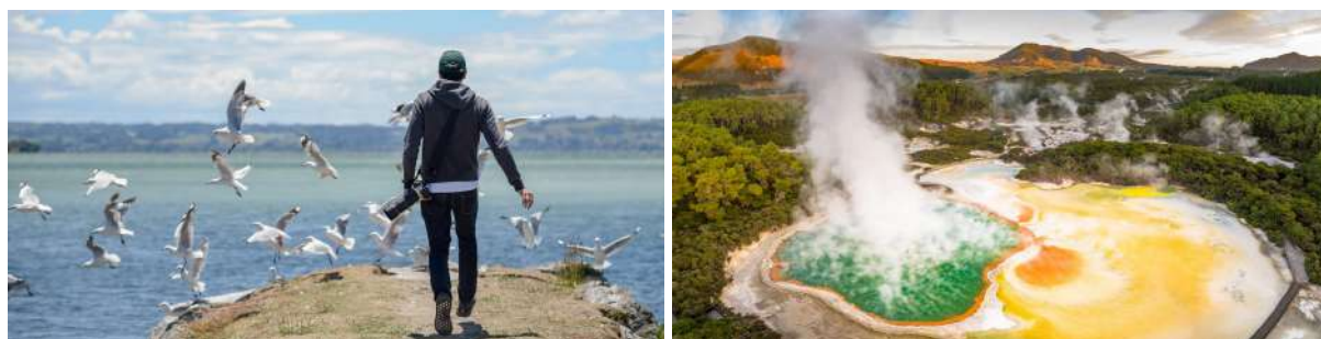
(左：罗托鲁瓦湖畔；右：怀奥塔普地热世界“香槟池”)

即使不准备自费参与以上游览，也能趁阳光明媚去罗托鲁瓦湖边赏景，徜徉于端庄大气的市政公园与博物馆之间，在库伊劳公园的免费温泉“足疗”池放松。