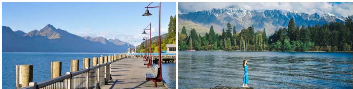
(左：皇后镇沿湖步道；右：瓦卡蒂普湖畔远望卓越峰)

抵达皇后镇之前，你会在群山环抱的历史金矿小镇——箭镇，度过午后时光。第一代抵达新西兰的华人矿工聚居地遗址还在、满镇参天古树还在、斑驳的泥墙也还在……南半球金秋时节（4月底至5月中），箭镇漫山遍野各色落叶飘零，更衬托出这里古朴却绚烂的美丽。