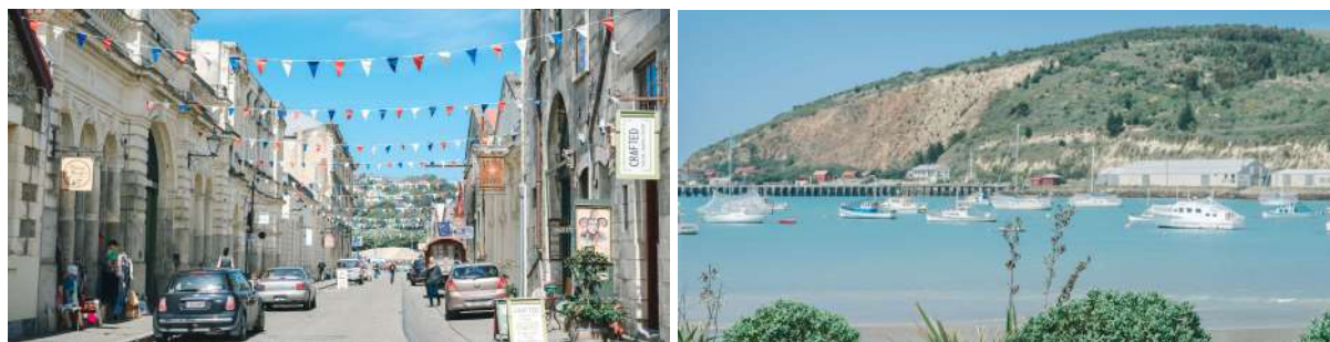
(左：奥马鲁维多利亚时代古建筑；右：奥玛鲁海港)

临近中午，Stray巴士会如步入“时空隧道”般，抵达复古小镇奥马鲁。港口街上，每一栋建筑、每一家小店，甚至走在路上着装复古的每一位当地人，都能让你有误入150多年前，维多利亚时代新西兰的错觉。除了丰富的历史，奥马鲁更引领着世界蒸气朋克艺术（源于工业革命早期的科幻艺术风格）；这里的蒸气朋克总部博物馆，绝对值得你去发现惊喜。