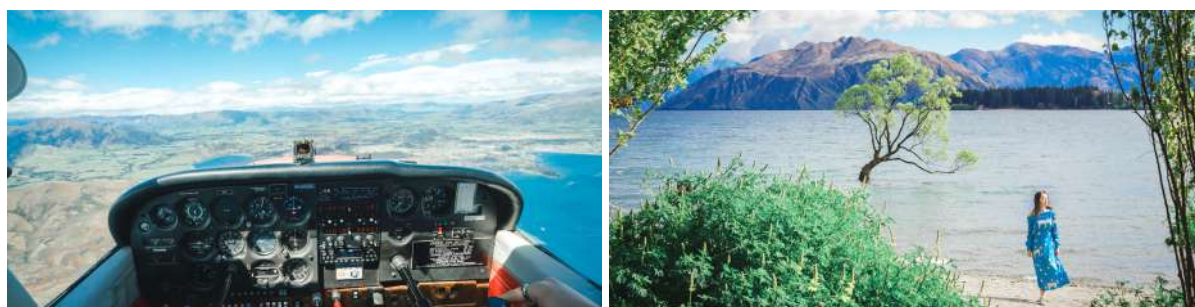
(左: “学开飞机” 试驾体验; 右: 瓦纳卡湖中孤树)

午餐后, 你将经过崎岖裸露的峡谷、荒草遍野的秃山, 路过新西兰国道海拔最高点——林迪斯山口; 随着道路两旁的颜色逐渐由枯转绿, 奥塔哥湖区悠悠牧场与成片葡萄庄园随之映入眼帘。