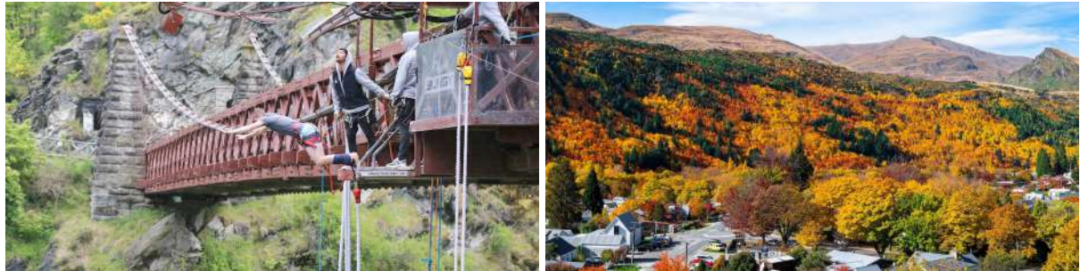
(左：卡瓦劳桥蹦极；右：箭镇秋景)

从瓦纳卡湖到皇后镇的瓦卡蒂普湖，今天搭乘巴士的时间较短，但每一个游览地都充满中央奥塔哥湖区的格调。穿越赤道与南极点的中点南纬45°线后，你会看到一颗硕大的“苹果”竖立在小镇克伦威尔之中。这里是中央奥塔哥地区——新西兰日照最长的区域；也因昼夜温差巨大，当之无愧成为新西兰“水果之乡”。每年12月底至次年1月中的盛夏，享誉全世界的新西兰车厘子，便独独收获于此。你有机会在琼斯家水果店挑选琳琅满目的可口应季水果，并品尝本地鲜果所制神秘甜品。