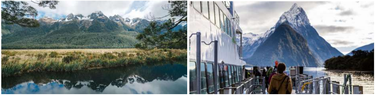
(左：峡湾国家公园内“镜湖”；右：峡湾游船出发)

当牛羊消失，路边栅栏不见，陡峭的高峰从开阔山谷中突然升起，开始出现峡湾最典型的U型谷构造。此刻，你已身处国家公园之中，这是新西兰面积最大的原生独特动植物庇护所。越往深处走，原始森林愈发茂密，湖水急流点缀穿插其间。当山谷越来越窄，树就越来越少，山便越来越高，直到随巴士穿越南阿尔卑斯山分水岭中的赫默隧道后，米尔福德峡湾就快到了。