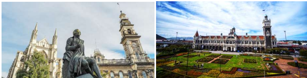
(左：但尼丁城市中心“八角广场”；右：“姜饼乔治”但尼丁火车站)

除了游览市区古迹，选择去发现郊外奥塔哥半岛海岸线的“秘密”，则能奇遇独特的野生动物及自然风光。这里是海岸野生动物的完美栖息地，在本地专业向导带领下，你有机会邂逅毛皮海狮、海豹、皇家信天翁，观赏黄眼企鹅或小蓝企鹅归巢。而如果选择造访新西兰保存最完好的拉纳克城堡庄园，深深的历史厚度与质感会令你有恍如隔世之感。