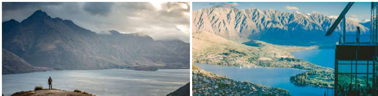
(左：皇后镇后山山顶鸟瞰瓦卡蒂普湖；右：皇后镇Skyline天际线全景)

今天你可以完全自由探索皇后镇。“世界冒险之都”的无穷魅力，只有真正沉浸其中才能感受到！你一定可以找到自己喜爱的游玩方式：刺激的峡谷蹦极或大秋千、瓦卡蒂普湖高空跳伞；或者舒缓慢节奏的百年蒸汽船厄恩斯劳号游湖与瓦尔特峰牧场游、皇后镇天际线山顶缆车、滑板车与景观自助餐等等。如果想与自然零距离接触，皇后镇后山徒步与攀登镇外海拔最高点本·洛蒙德峰，是不错的健行选择。当然轻松惬意地沿湖漫步皇后镇花园，也能让你从湖畔不同视角，观赏瓦卡蒂普湖与百变皇后镇。