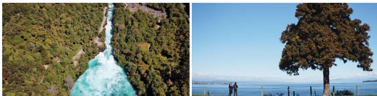
(左：胡卡瀑布航拍全景；右：陶波湖畔远眺汤加里罗国家公园火山群)

午后，行驶于罗托鲁瓦湖和陶波湖两座“超级火山口”之间，这里是新西兰地热活动最活跃区域。当听见轰隆作响的水声时，胡卡瀑布就在眼前。走到最近处观赏喷涌而出而相当清澈的瀑布水，你会惊叹“矮矮的”胡卡瀑布为何能成为北岛标志性景观。