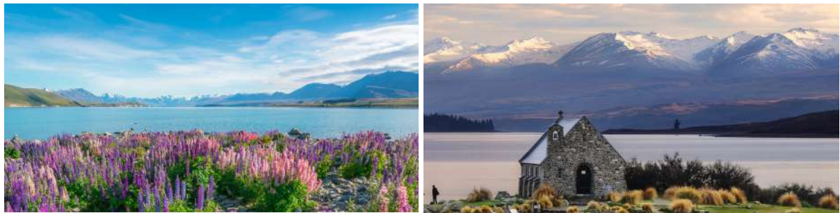
（左：夏天蒂卡普湖畔盛开的鲁冰花海；右：“好牧羊人教堂”）

这里属于南岛中央高地麦肯齐地区，拥有色彩饱和度最高的雪山、湖泊与草场。不论阴晴雨雪，蒂卡普湖总婀娜多姿；湖畔古老的好牧羊人教堂是当地人信仰的守望，与夏季沿湖盛开的鲁冰花 注2 组成令人最向往之梦境。