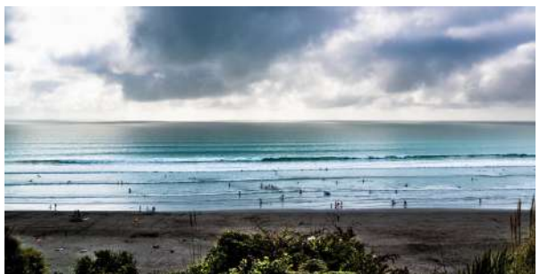
(左: 雷格兰港湾望外海; 右: 鲸鱼湾冲浪海滩)