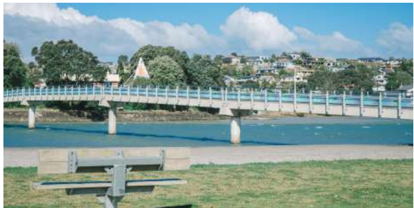
(左: 新娘面纱瀑布; 右: 雷格兰港湾美丽景色)

当海的气息越来越浓, 雷格兰便近在咫尺。在北岛西海岸这一精致小巧的海滨小镇中, 你可以一下午狂野地在海水的怀抱里, 享受冲浪奔驰的快感; 还可以沿着港湾黑沙滩漫步, 等待灿烂夕阳照得雷格兰“闪闪发亮”; 也可以走进一间本地艺术品商店, 沾染些小镇中的那股文艺“味道”。