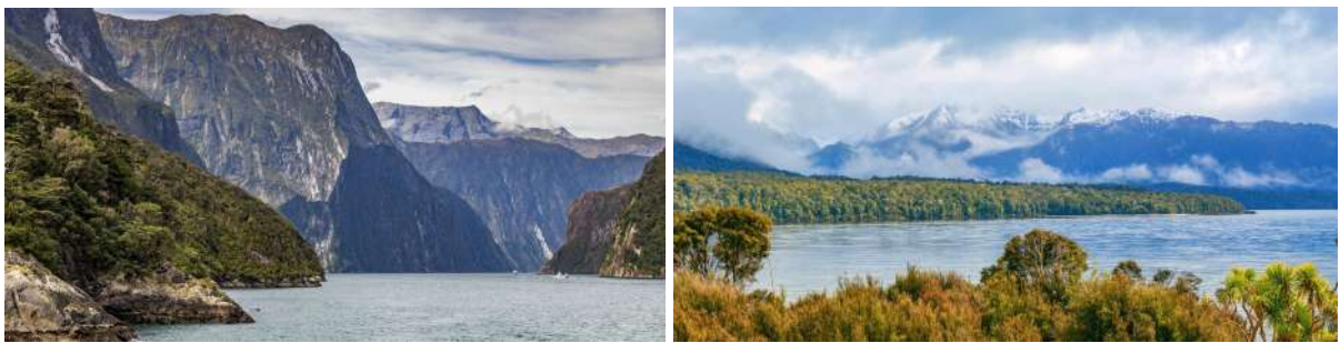
(左：雄伟壮阔的米尔福德峡湾；右：安宁的蒂阿瑙湖)

当牛羊消失，路边栅栏不见，陡峭的高峰从开阔山谷中突然升起，开始出现峡湾最典型的U型谷构造。此刻，你已身处国家公园之中，这是新西兰面积最大的原生独特动植物庇护所。越往深处走，原始森林愈发茂密，湖水急流点缀穿插其间。当山谷越来越窄，树就越来越少，山便越来越高，直到随巴士穿越南阿尔卑斯山分水岭中的赫默隧道后，米尔福德峡湾就快到了。