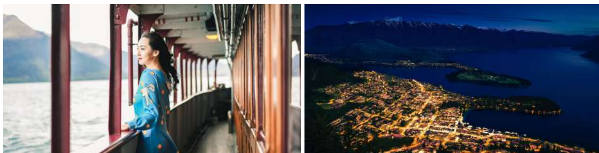
(左：“TSS厄恩斯劳号”百年蒸汽船游湖；右：皇后镇Skyline天际线夜景)

要是你热爱夜生活，不妨约上新认识的旅行小伙伴，去镇中心酒吧小酌几杯，放松身心，享受这座繁华小镇的小资情调。