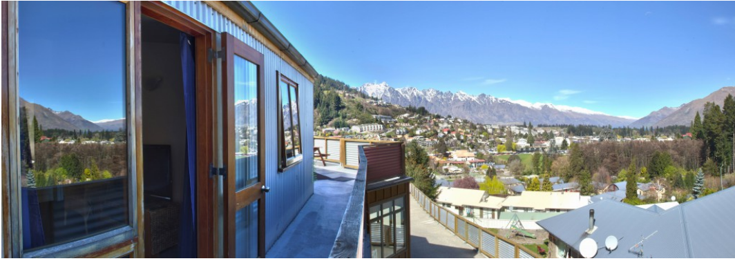
第四晚：瓦纳卡——Base Backpackers Wanaka